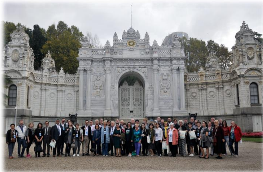
Vor einer der Kulissen des Dolmabahçe Palastes.

Den türkischen Freunden ist ein grosser Dank für eine interessante Tagung auszusprechen.