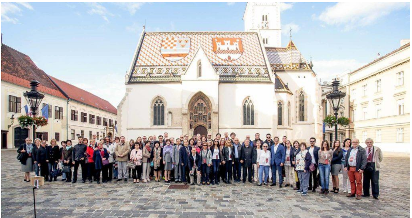
Die am Schlussausflug verbliebenen Teilnehmenden am Council Meeting 2016 in Zagreb/Kroatien

Das Treffen wurde abgerundet durch ausserordentlich interessante Präsentationen von IPRS (Intersteno Parliamentary and other professional Reporters' Section), eine Stadtführung mit einem Besuch des Parlaments und ein gemütliches gemeinsames Abendessen an einem Ort ausserhalb der Stadt, wo dokumentiert ist, dass hier schon zwei Päpste diniert haben. Der Wirt zeigt Fotos an den Wänden und, quasi als Reliquien, das original päpstlich benützte Geschirr unter sich bereits leicht eintrübendem Glas. Unvergesslicher Höhepunkt bleibt der Schlussausflug zu den kristallklaren Plitwitzer Seen mit den unzähligen rauschenden Wasserfällen.